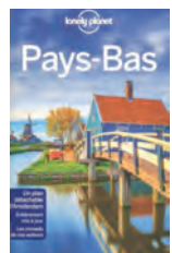
PAYS-BAS Lonely planet