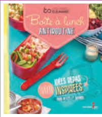
BOÎTE À LUNCH ANTIROUTINE L'escouade culinaire