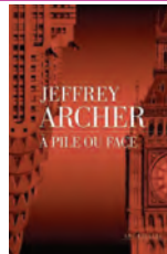
À PILE OU FACE Jeffrey Archer