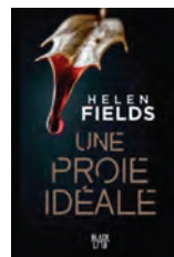
UNE PROIE IDÉALE Helen Fields