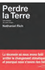
PERDRE LA TERRE Nathaniel Rich