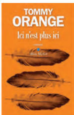
ICI N'EST PLUS ICI Tommy orange